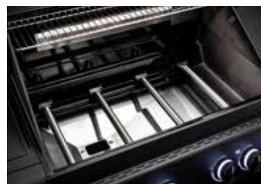
Brennkammer mit Alu-Druckguss-Elementen