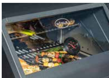
Panorama-Glasdeckel für noch mehr Einblicke