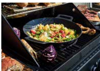
Vario+ Grillrostsysteem, Grillroste aus Gusseisen