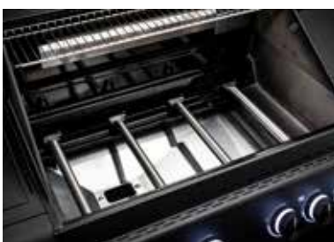
Brennkammer mit Alu-Druckguss-Elementen