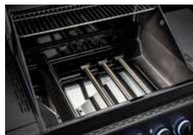
Brennkammer mit Alu-Druckguss-Elementen