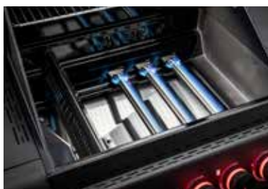
Integrierte CRISPZONE für Temperaturen bis 450 °C