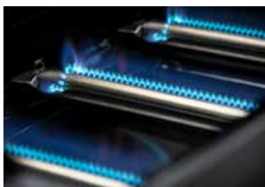
HEATSPIRE-System für optimale Temperaturverteilung