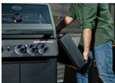
Ohne Werkzeug abklappbare Seitentische