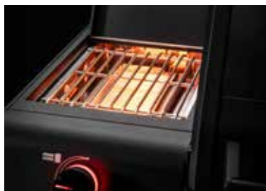
Extra heiße PRIMEZONE bis 800 °C (4 kW)